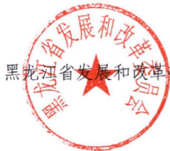
黑龙江省发展和改革委员会