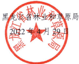
黑龙江省林业和草原局