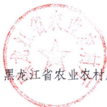
黑龙江省农业农村厅